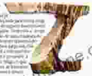
环球艺术杂志对一位著名艺术家的采访